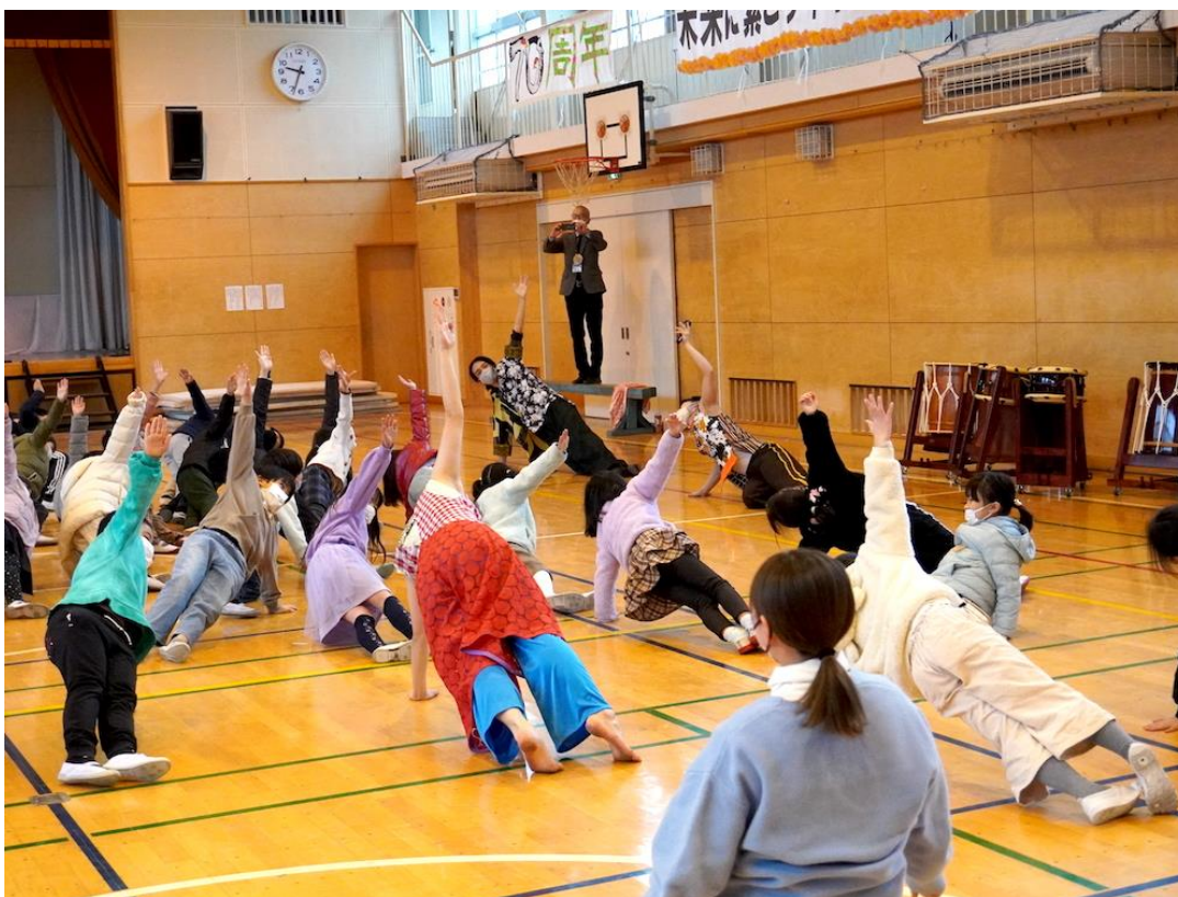
下末吉小学校（鶴見区）

象の鼻テラスは、横浜開港150周年を記念して整備された象の鼻パーク内の休憩施設です。横浜市が推進する新たな都市ビジョン「文化芸術創造都市クリエイティブシティ・ヨコハマ」を推進する文化観光交流拠点の一つに位置づけられ、アールスペースとカフェを併設し、新しい時代の「文化交易」の拠点となることを目指して、多ジャンルのアートプログラムを展開しています。併設した象の鼻カフェでは、各プログラムに連動したメニューの提供などを行っています。これまでに学校プログラムでは、美術造形や作曲・ミュージカル等の音楽、身体表現などの授業を実施しています。