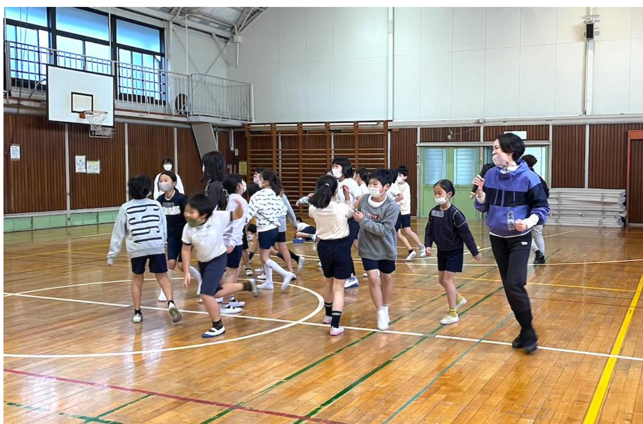
不動丸小学校（旭区）

これまでに学校プログラムでは、コンテンポラリーダンスや演劇創作、演劇鑑賞などの授業を実施しています。