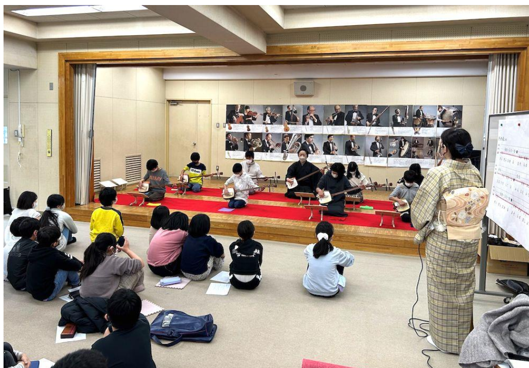
荏田第一小学校（都筑区）

（公財）横浜市芸術文化振興財団は美術、音楽、演劇等の芸術文化活動を総合的に振興し、開港以来培われてきた豊かな文化的伝統の維持と、横浜市独自の芸術文化の推進を図り、もっとゆとりと生きがいに満ちた市民生活の実現と国際文化都市・横浜の進展に寄与する目的で平成14年度に設立されました。平成16年度以来「芸術文化教育プログラム」を横浜市、市教育委員会、S Tスポット横浜とともに協働事業として市内の小・中・特別支援学校において実施しています。経営企画・ACYグループは、横濱JAZZ PROMENADEを主軸としたコーディネーターとして参画、アーティストを講師として派遣し、主に音楽（舞踊、伝統芸能等も対応）の授業を実施しています。これまでに学校プログラムでは、箏や三味線などの授業を実施しています。