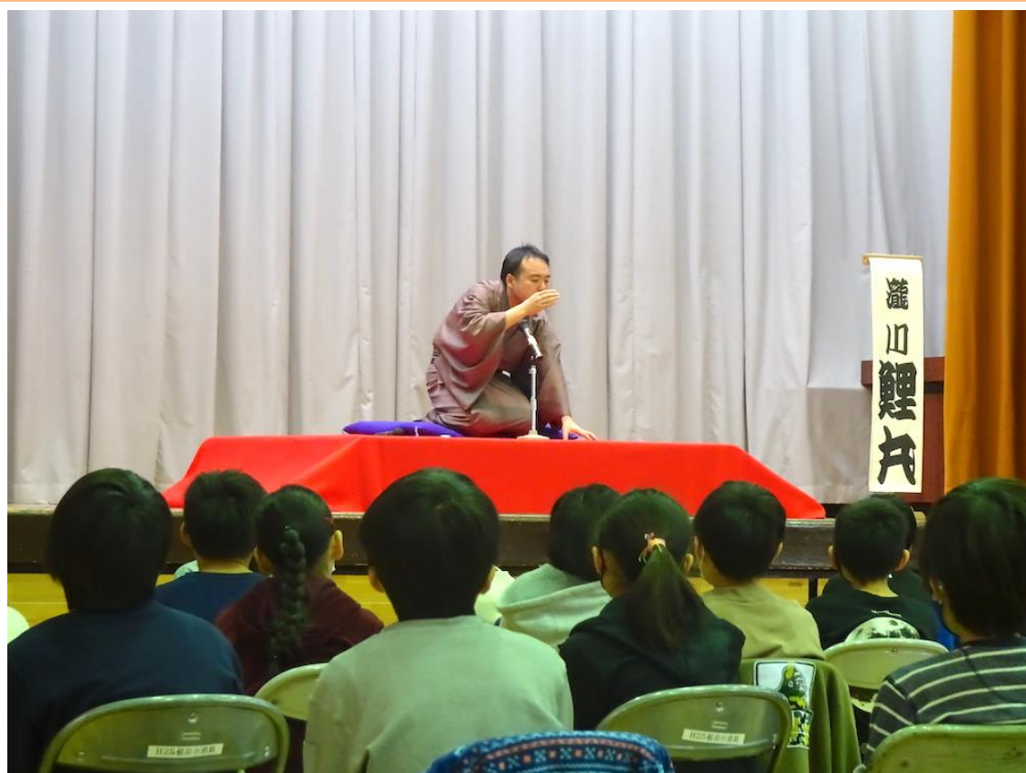
根岸小学校(磯子区)