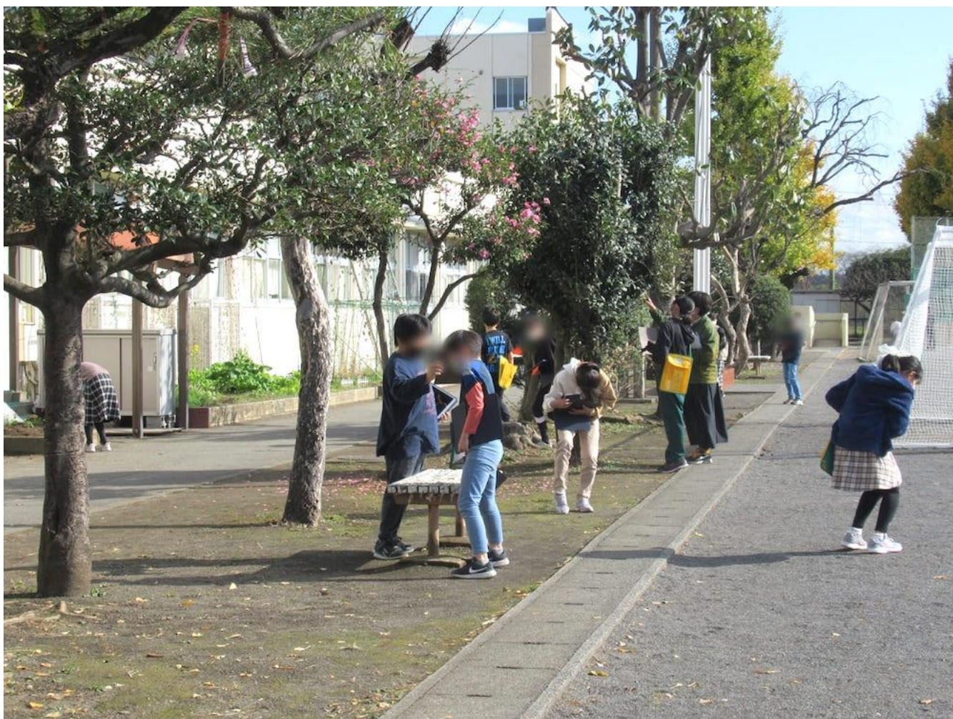
上瀬谷小学校（瀬谷区）

2022年3月1日に開業した横浜市瀬谷区にある文化施設です。昇降式ステージを使用して、コンサートや発表会、鏡面壁を使用しているダンスの練習、大人数でのオーケストラの練習など、多用途に使用できる音楽多目的室の他に、2部屋あるギャラリーは個別での利用はもちろん、2部屋を繋げて利用でき、さらに隣接する会議室も繋げる事によって自由度の高い展示スペースを創り出せます。3部屋ある会議室も個別での利用の他に繋げて利用する事で、大人数での会議にも対応可能です。練習室は、グランドピアノを要しアコースティックな楽器の練習に適した部屋と、ドラムセットやギターアンプ、ベースアンプを完備したバンド練習に適した部屋の2部屋があります。貸館業務のほかに、地域の芸術文化振興と瀬谷区の新たな文化拠点として、コンサートや展覧会、ワークショップなど様々なイベントを開催しています。