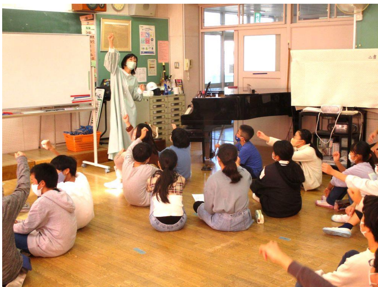
金沢小学校（金沢区）

これまでに学校プログラムでは、造形や民族音楽、作詞作曲などの授業を実施しました。