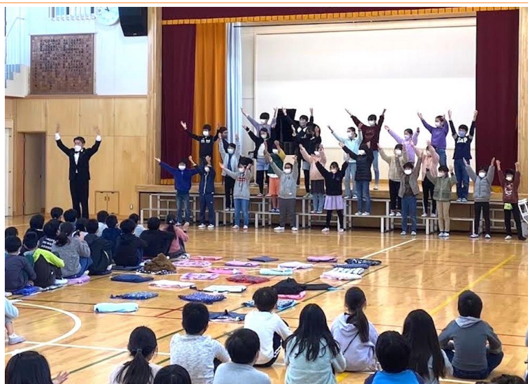
中丸小学校（神奈川区）

2011年8月に芸術で社会貢献を考え実行する市民団体として横浜で発足。以来、芸術を通じた社会貢献活動や国際交流事業を行っています。特に東日本大震災被災地支援として現地の仮設住宅世帯向けの施設や小学校、保育園、介護施設などで、コンサートやワークショップを毎月欠かさず提供。生活に寄り添えるような芸術で、人々の生活再生を後押しできるような約8年間に東北・熊本で200回強開催しています。海外のカンパニーと共同制作や国際教育音楽祭の制作なども担当。コンサートやワークショップを担当するのは才能あるアーティストたち、芸術を届けたいアーティストとそれを必要とする人をつなげる役割を当法人が担っています。2015年第9回かながわ子ども・子育て支援大賞特別賞受賞。2021年内閣府より子ども・若者育成支援部門の活動に対して「内閣府特命担当大臣表彰」を受けました。これまでに学校プログラムでは、合唱や邦楽、オペラなどの授業を実施しています。