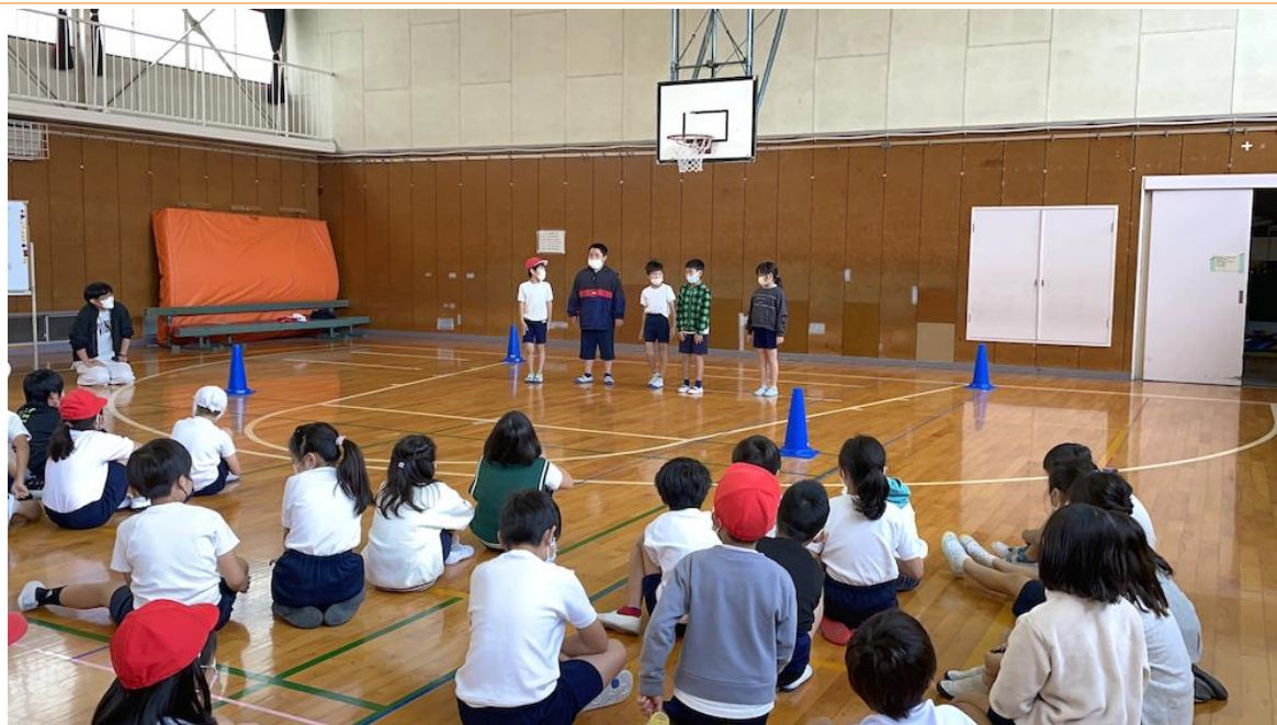
上白根小学校（旭区）

をコンセプトに、各施設の貸し出しだけでなく、旭区民の文化芸術を通じた「喜びづくり」、旭区の「地域活性化」「地域価値向上」を目指します。多彩な自主事業を展開し、芸術文化を通して、旭区からパワーを発信しています。これまでに学校プログラムでは、ミュージカルやゴスペル、演劇創作などの授業を実施しています。