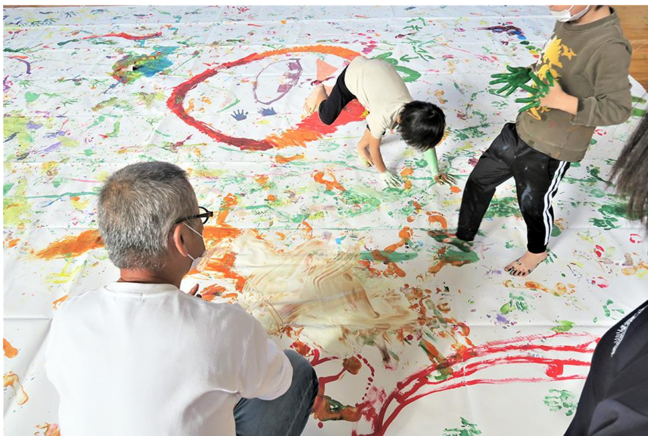
田奈小学校（青葉区）

横浜市民ギャラリーは開館50年を機に関内から西区宮崎町に移転しました。市民の発表および制作の場として展示室やアトリエの貸し出しを行うほか、今日の多様な表現をさまざまな視点で紹介する企画展やコレクション展、半世紀以上続く「横浜市こどもの美術展」、子どものための造形講座「ハマキッズ・アートクラブ」、大人を対象にしたアトリエ講座やレクチャーなどの自主事業を行っています。また、市内の美術展覧会情報を網羅した情報誌『画廊散歩』を発行するなど、市民の活動を支援する身近なギャラリーとして親しまれています。これまでに学校プログラムでは、造形や土粘土などの授業を実施しています。