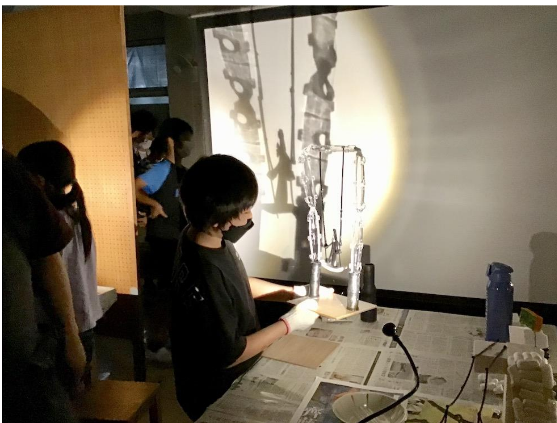
すみれが丘小学校（都筑区）

横浜市民ギャラリーあざみ野は、美術・工芸を基本としつつ、ジャンルを超えた「創造性溢れる表現活動」を幅広く育み、創造性を介して人と人が交流することのできる、市民と創造活動の出会いの場をつくることを目的としています。これまでに学校プログラムでは、造形や金属加工、身体表現などの授業を実施しています。