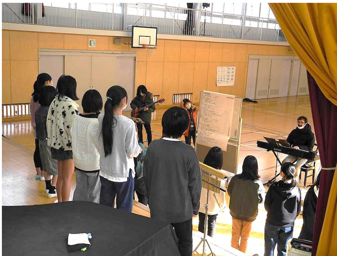
寺尾小学校（鶴見区）

平成23年(2011年)3月に開館した横浜市鶴見区にある文化施設です。通常時548名を収容し、音楽・演劇・ダンスなど用途に合わせて使用できる多目的ホールの他に、100名を収容する残響豊かな音楽ホール、自由自在に芸術作品を展示できるギャラリー、リハーサル室、練習室を兼ね備えています。貸館業務・自主事業制作を行うほか、地域の文化振興と鶴見の文化拠点として、近隣学校等においても多角的な活動を目指しています。サルビアホール独自のオーディションによって選ばれた「サルビア・アーティストバンク」には、多彩な才能あふれるアーティストたちが登録されています。これまでに学校プログラムでは、ジャズ、箏、落語の授業を実施しています。