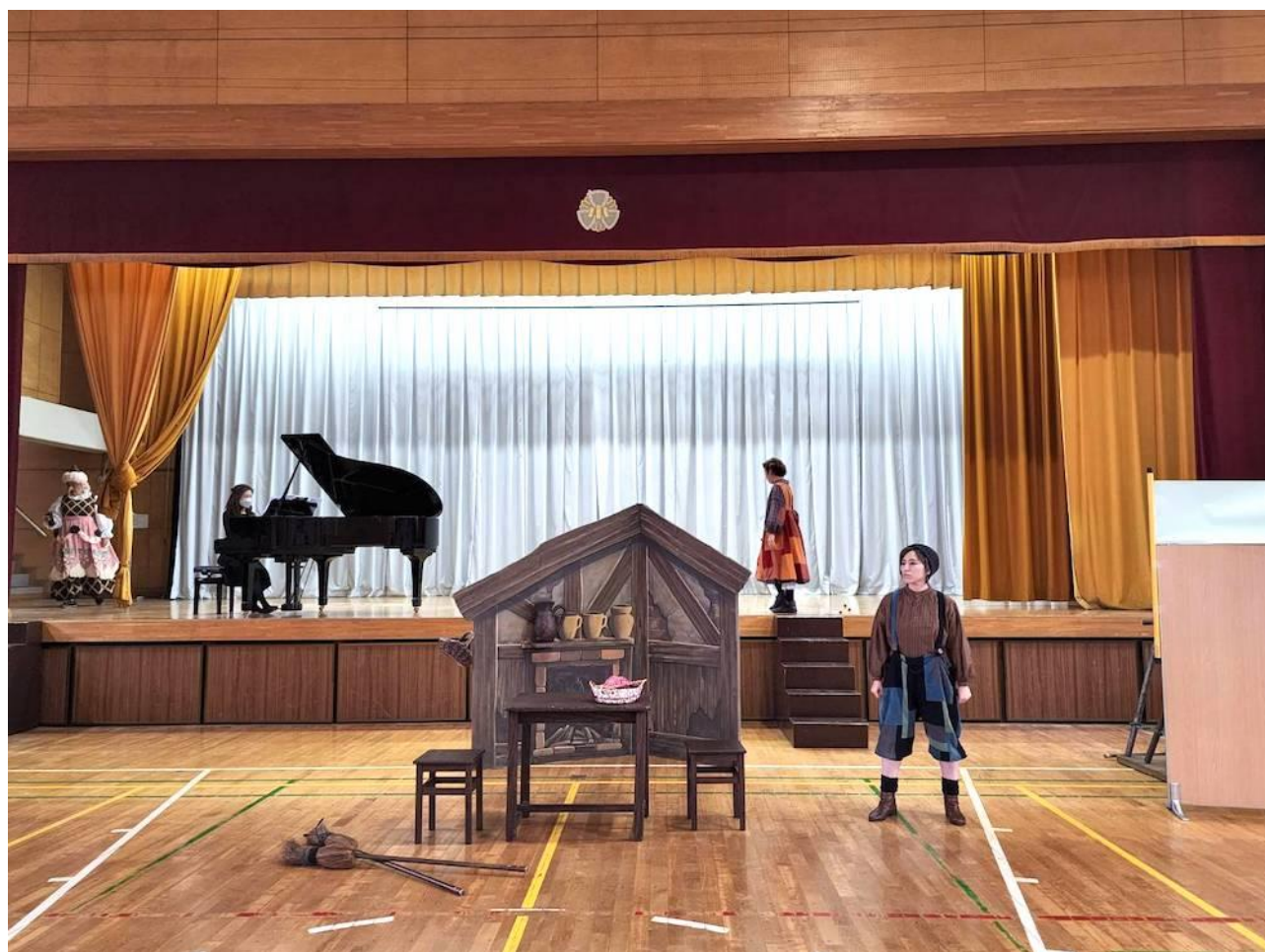
川和小学校（都筑区）