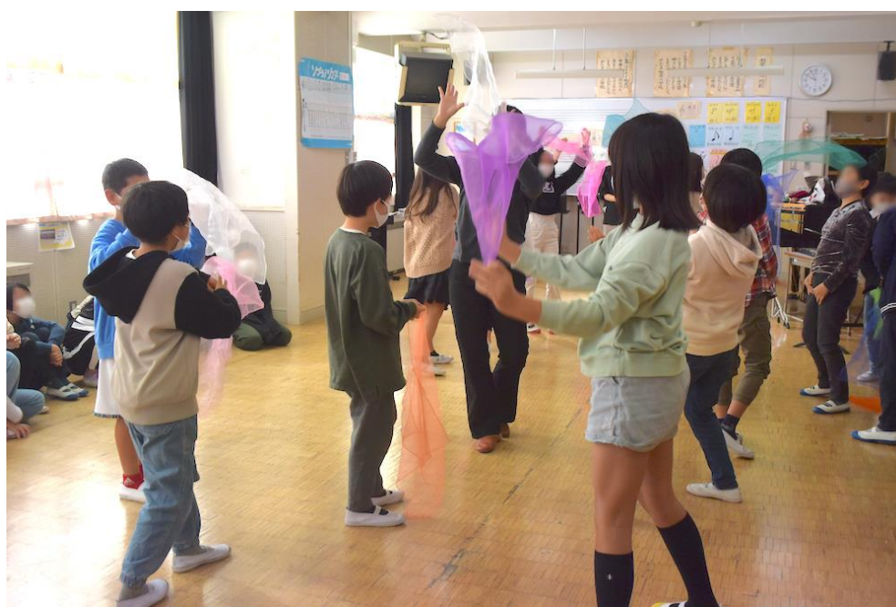
柏尾小学校（戸塚区）

さくらプラザは、今年開館10周年を迎える、2013年8月にオープンした芸術文化施設です。戸塚駅に直結し、アクセスの良い場所で文化の発信・拠点としてさまざまな芸術活動の普及・支援をおこないます。本格的なクラシックコンサート・伝統的な古典芸能など世界で活躍する多彩なアーティストを招き、上質な芸術体験を提供するとともに、ワークショップやアウトリーチ活動など地域への普及事業をアーティストと協力して実施します。そこに暮らす人々が芸術文化に触れる時間と空間を創造し、区民のステイタスの向上に貢献します。これまでに学校プログラムでは、音楽や演劇、小鼓や箏・津軽三味線などといった伝統芸能の授業を実施しています。