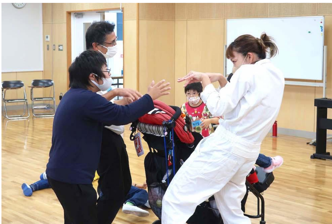
緑園義務教育学校（泉区）

平成20年度からは「横浜市芸術文化教育プラットフォーム」の事務局を担当し、学校教育とアートの現場をつなぐ事業を推進しています。これまでに学校プログラムでは、身体表現や現代美術、箏などの授業を実施しています。