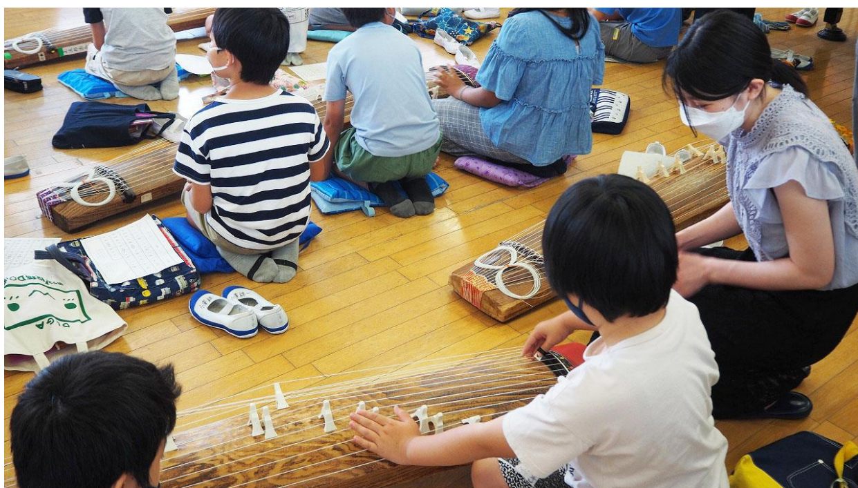
港南台第三小学校（港南区）

吉野町市民プラザは、横浜で最初の市民プラザとして1989年に開館いたしました。地域の身近な文化施設としてホール、ギャラリー、会議室、スタジオを備え、鑑賞・発表・練習等で多くの方にご利用いただいております。地域の拠点施設としての役割を活かし、区民の芸術文化を通じた地域の発展と活性化を目指しています。施設での芸術鑑賞・体験型事業のみならず、地域文化団体や学校との連携・サポートを図り、地域に根ざした活動を行っています。これまでに学校プログラムでは、箏や和太鼓、よさこい、タップダンスなどの授業を実施しています。