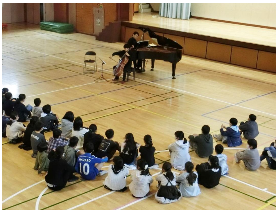
荇田西小学校（青葉区）

これまでに学校プログラムでは、ヴァイオリン、チェロやピアノなどの授業を実施しています。