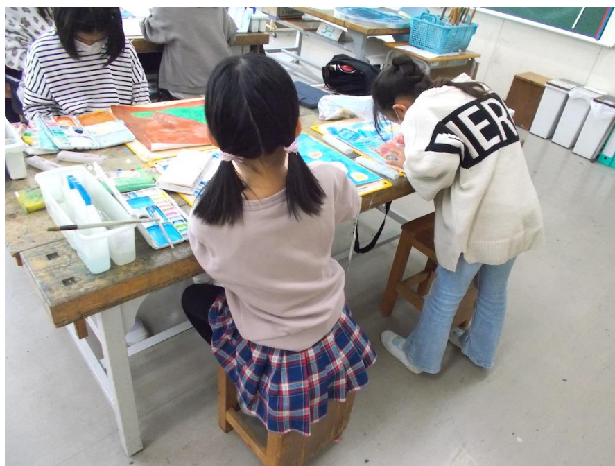
稲荷台小学校（西区）

これまでに学校プログラムでは、箏、和太鼓、造形、日本舞踊などの授業を実施しています。