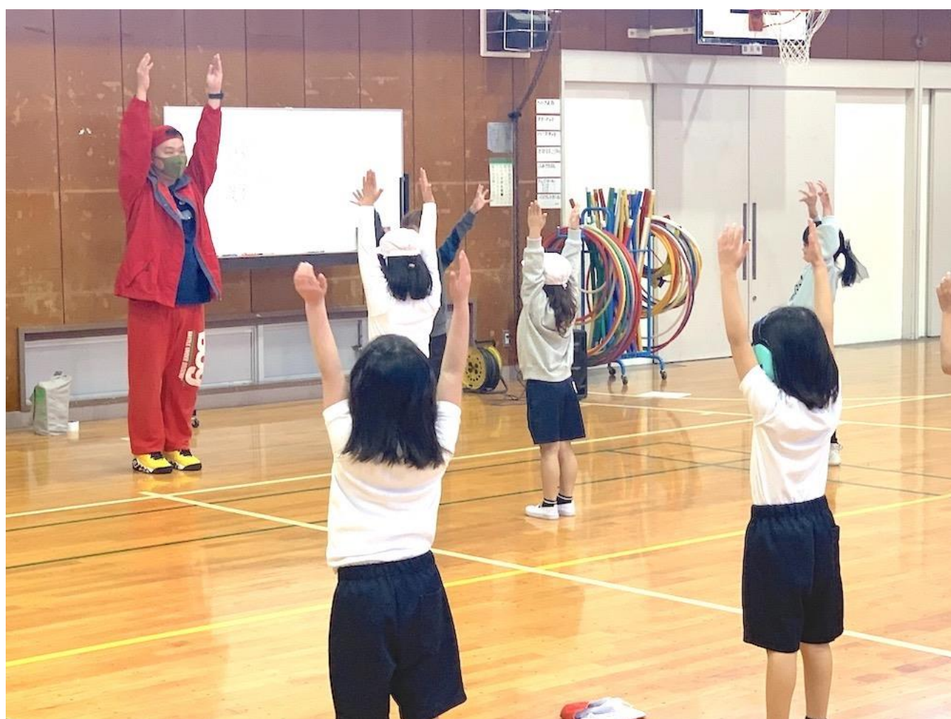
大道小学校（金沢区）

これまでに学校プログラムでは、身体表現、コンテンポラリーダンスなどの授業を実施しています。