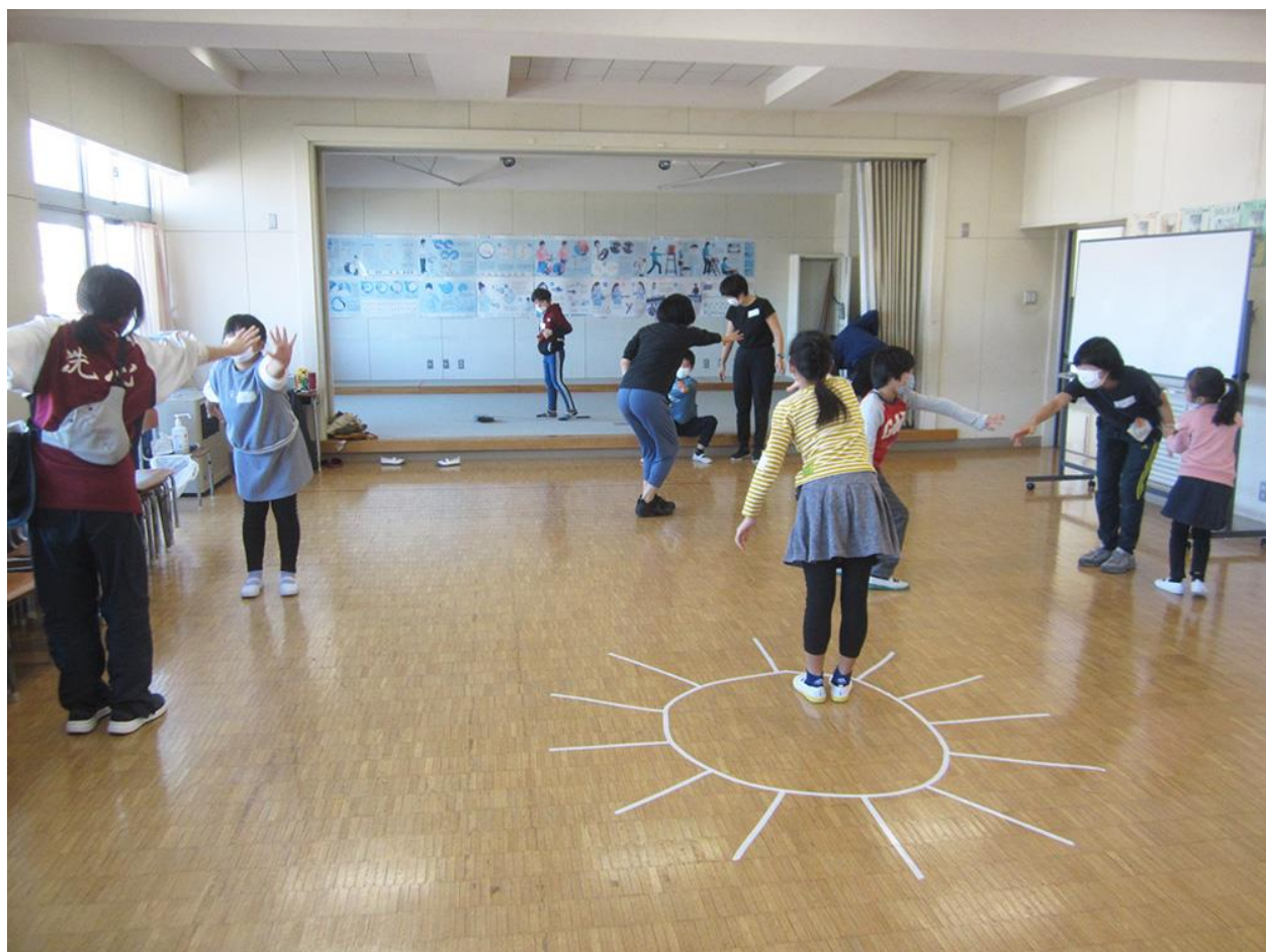
さつきが丘小学校（青葉区）

横浜市芸術文化教育プラットフォーム／学校プログラムでは、2007年度より授業のコーディネートを担当しています。これまでに学校プログラムでは、コンテンポラリーダンスやパフォーマンス創作などの授業を実施しています。