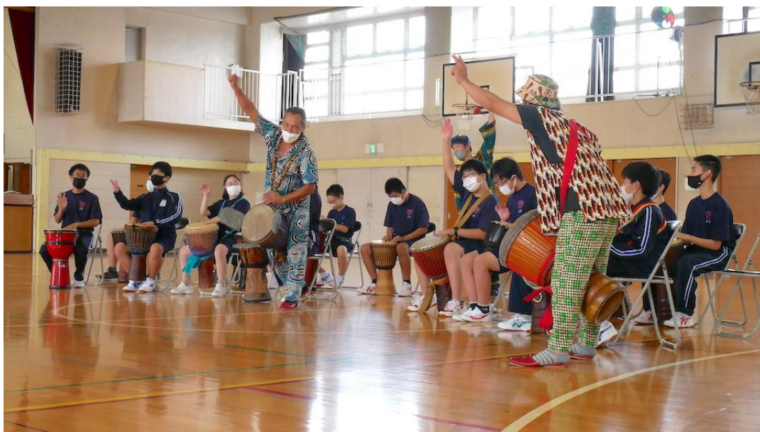
新田中学校（港北区）