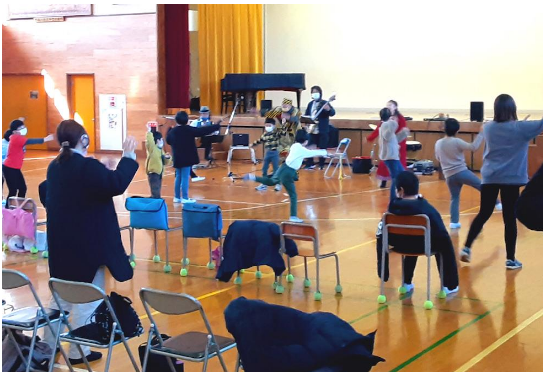
北山田小学校（都筑区）

これまでに学校プログラムでは、造形やラテン音楽、お芝居づくりなどの授業を実施しています。