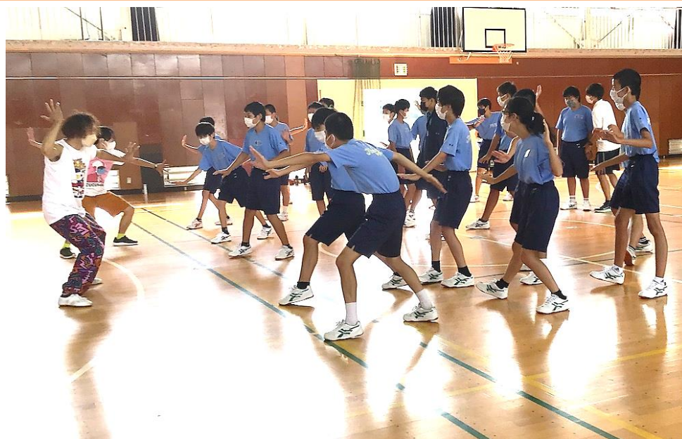
保土ヶ谷中学校(保土ヶ谷区)

これまでに学校プログラムでは、コンテンポラリーダンスを軸に、音楽、美術、邦楽などの授業も実施しています。