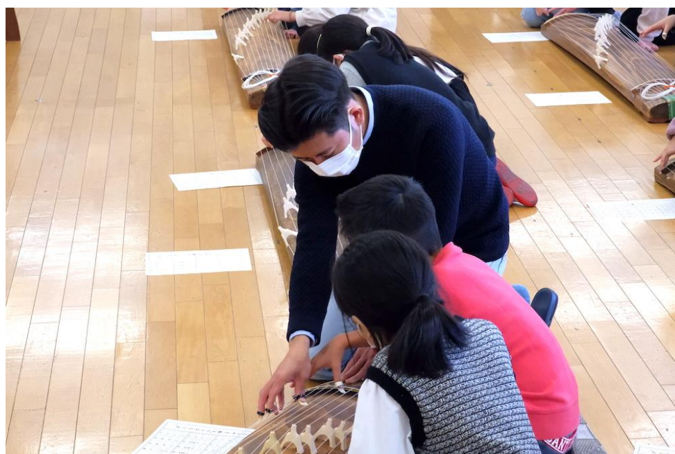
幸ヶ谷小学校（神奈川県）