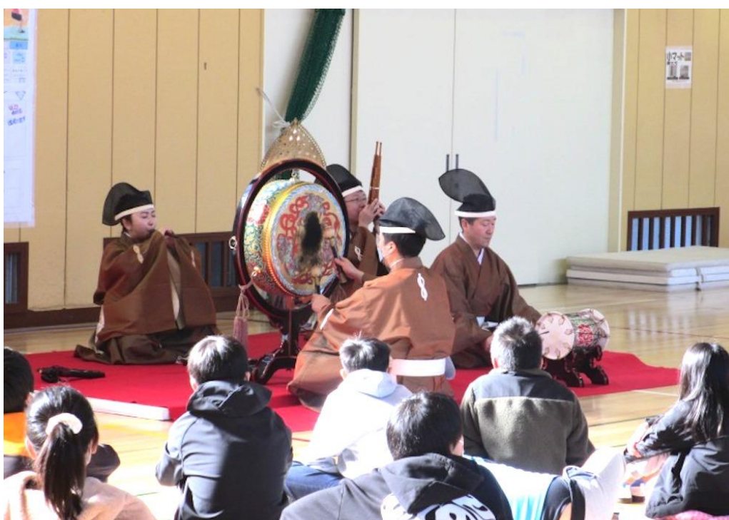
伊勢山小学校（泉区）

テアトルフォンテは1993年に開館した、演劇やダンスの上演に最も適した「ホール」を中心とする文化施設です。観る・演じる・創る、この3つの活動を通し、地域の交流、文化活動の活性化の発展に努めています。一般公募の市民が出演する市民参加型ミュージカルを始め、子どもから大人までを対象にした演劇・音楽・ダンスなどのワークショップの開催、国内外で活躍するアーティストを招いてのコンサートや公演事業など、芸術鑑賞の場を提供するとともに、文化活動支援にも力を入れ、「ものづくり」を行う場所としての使命と役割を担っています。これまでに学校プログラムでは、雅楽や合唱などの授業を実施しています。