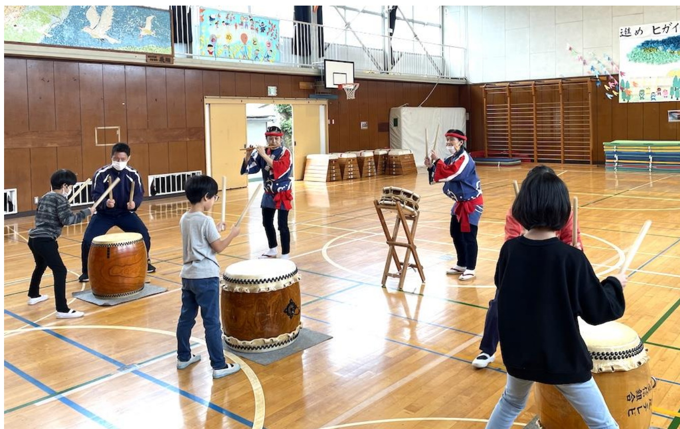
東市ケ尾小学校（青葉区）