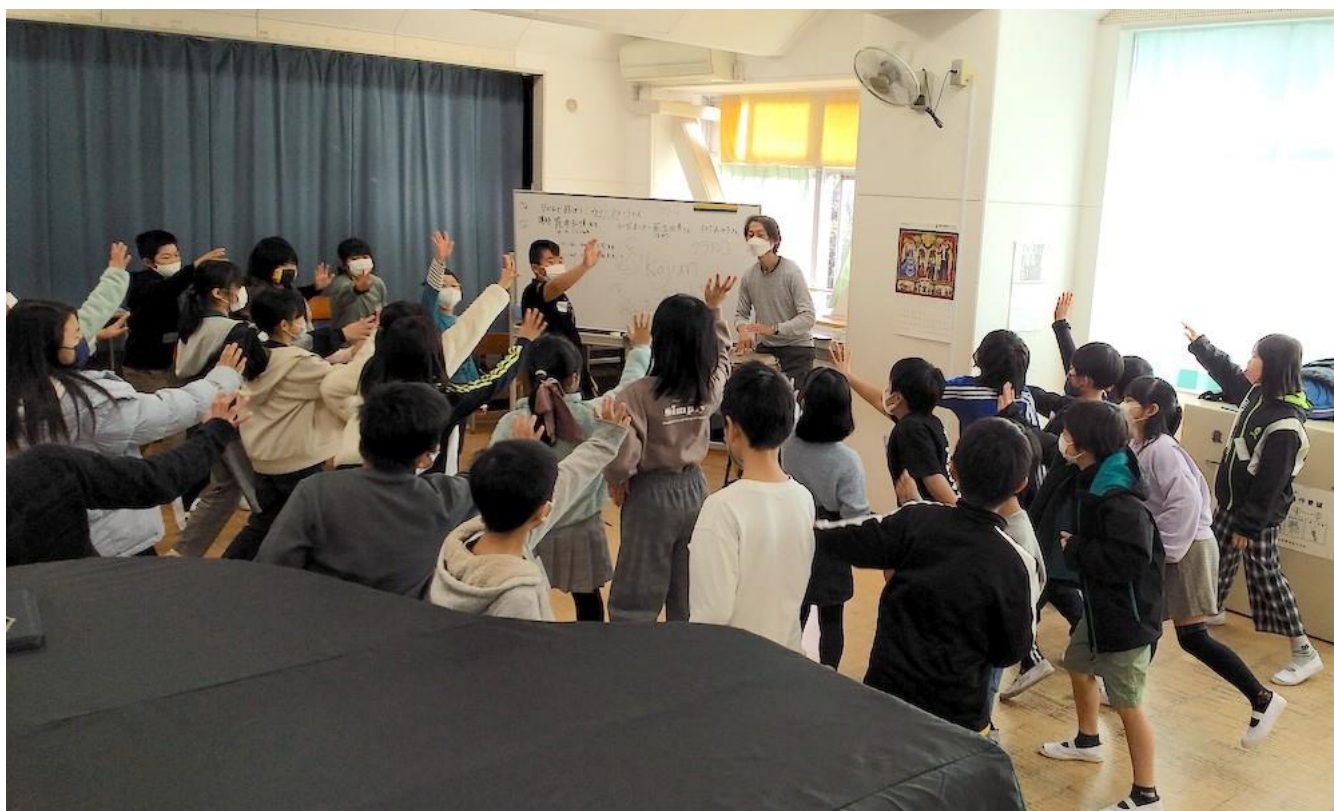
小雀小学校（戸塚区）

学校プログラムでは、子どもたちが「日常」をより豊かに生きるために、アーティストの感性に触れるという「非日常」の体験を通して、『いつもと違う自分』の発見をしてもらえたらと思っています。ビートを感じて歌う・踊るといった表現活動や、抽象画・鑑賞に力点を置いた創作活動など学校の授業とは違うアプローチでのワークショップを実施しています。