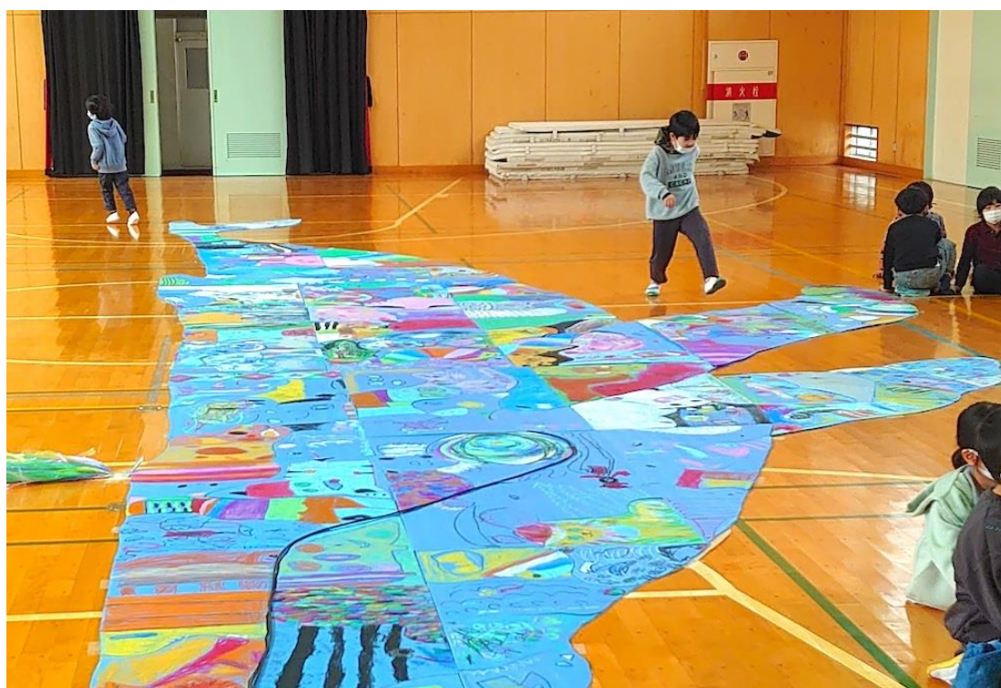
さわの里小学校（磯子区）