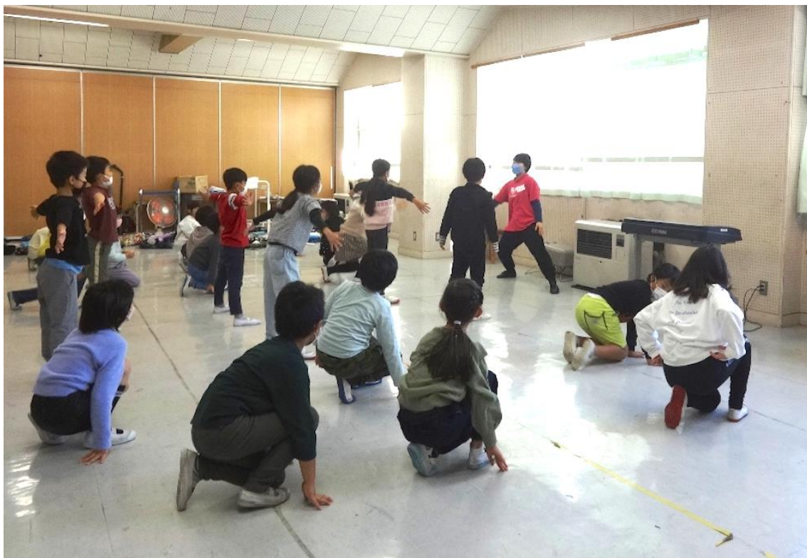
小菅ヶ谷小学校(栄区)

2006年より「横浜市芸術文化教育プログラム」コーディネーター。1998年発足した「企画集団MUGEN」を母体に2005年設立の企業組合Media Globalを経て現在に至る。親子・子どものワークショップを得意とする。行政との協働・アートにかかわる人々とのネットワークを軸に活動をしている。これまでに学校プログラムでは、幅広いジャンルの授業を実施しています。