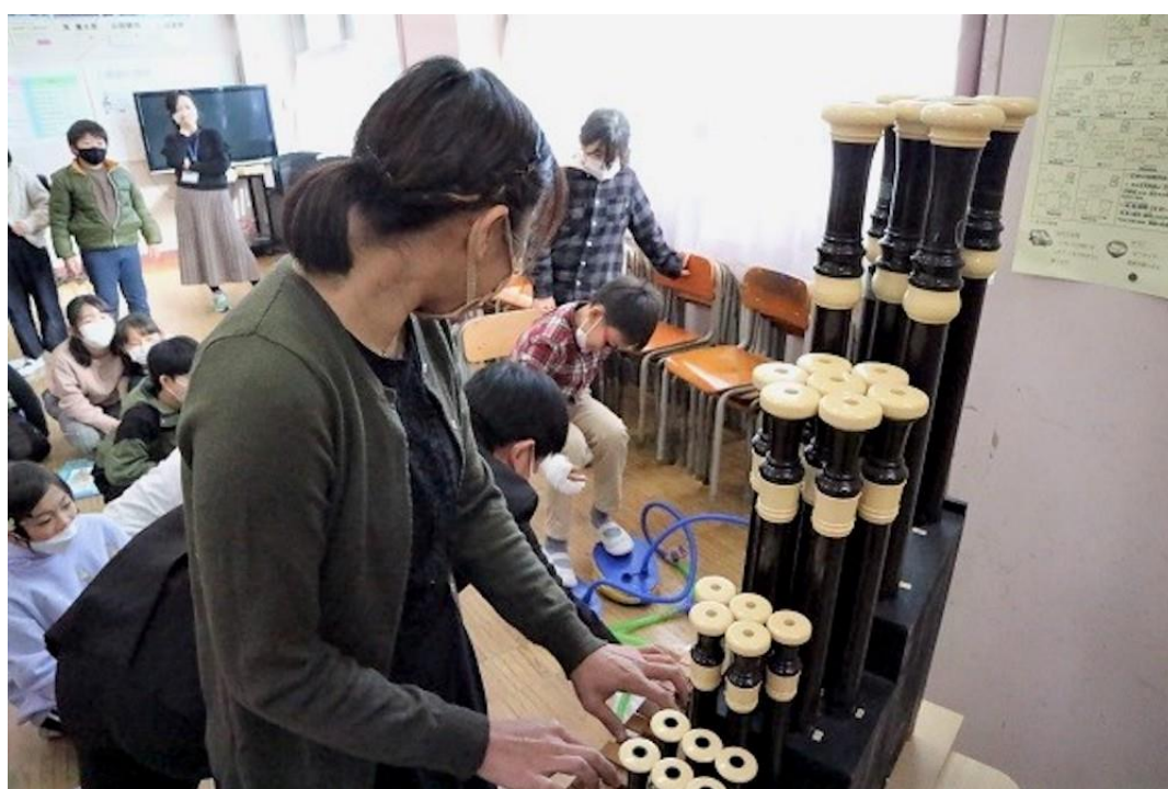
桜岡小学校（港南区）

私共、京急グループ共同企業体は平成18年度より、指定管理者として、上大岡の中心にある「港南区民文化センター ひまわりの郷」を運営しております。地域の方々のニーズに答えながら、年間50本程度の様々な事業を展開しております。子どもからシニアまで幅広い年齢層に対応するコンサートや体験型イベントを行なっています。（低料金で質の高いクラシックコンサート、乳児も対象の親子で楽しむ音楽コンサート、シニアを対象にした日本の伝統芸能（邦楽、落語）、小・中・高生のストリートダンスコンテスト他） これまでに学校プログラムでは、民族楽器や合唱などの授業を実施しています。