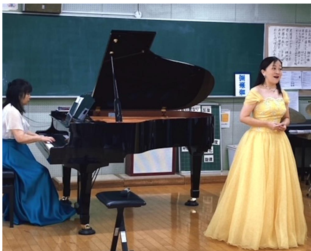
高田小学校（港北区）

これまでに学校プログラムでは、声楽や民族音楽、ミュージカルなどの授業を実施しています。