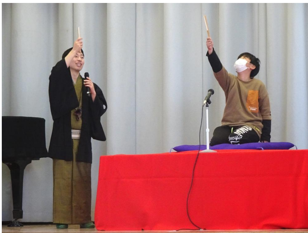
豊岡小学校(鶴見区)