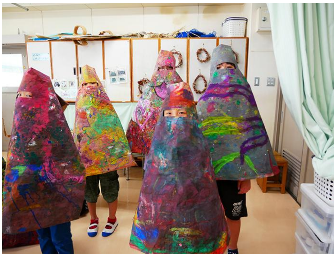
洋光台第三小学校(磯子区)

『Art Lab Ova』は、1996年に発足したアーティストによる非営利のユニットです。制作経験の有無やしょうがいの有無、年齢、国籍に関わらず、多様な人々が交流をできるアートプロジェクトを展開しています。2010年～多文化な下町にある映画館の1階に拠点であるアトスペース「横浜パラダイス会館」を開設し、近隣のこどもたちに開放しています。これまでに学校プログラムでは、造形を中心に、音楽、ダンスなどを含めた複合的な授業を実施しています。