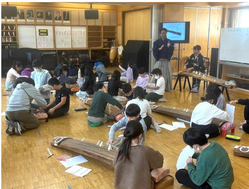
都田小学校（都筑区）

（公財）横浜市芸術文化振興財団は美術、音楽、演劇等の芸術文化活動を総合的に振興し、開港以来培われてきた豊かな文化的伝統の維持と、横浜市独自の芸術文化の推進を図り、もっとゆとりと生きがいに満ちた市民生活の実現と国際文化都市・横浜の進展に寄与する目的で平成14年度に設立されました。平成16年度以来「芸術文化教育プログラム」を横浜市、市教育委員会、STスポット横浜とともに協働事業として市内の小・中・特別支援学校において実施しています。経営企画・ACYグループは、横濱JAZZ PROMENADEを主軸としたコーディネーターとして参画、アーティストを講師として派遣し、主に音楽（舞踊、伝統芸能等も対応）の授業を実施しています。これまでに学校プログラムでは、箏や三味線などの授業を実施しています。