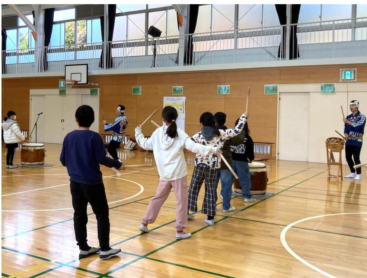
西柴小学校（金沢区）