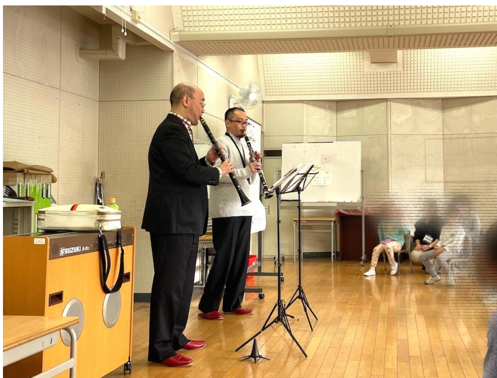
茅ヶ崎小学校（都筑区）

横浜市大倉山記念館は、横浜市内・市外の皆様に事前予約の上、ご利用いただける文化施設です。ギリシャ神殿を思わせる外観に、荘厳なエントランス、東洋を象徴する木組みを用いたホールも有り、横浜市指定有形文化財に指定されています。 映画やテレビドラマ、CMやMVなどの撮影にも数多く利用されている他、館内はご見学いただけます。館内の各施設は、小規模な音楽会、研修会、会議、趣味サークルなどに適しており、回廊式のギャラリーは、絵画、生花などの展示にご利用いただけます。 これまでに学校プログラムでは、声楽や民族音楽、箏などの和楽器の授業を実施しています。