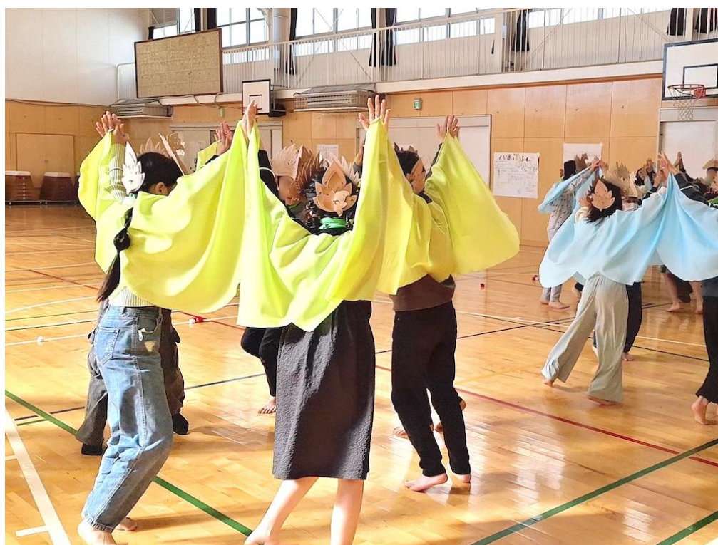
矢部小学校（戸塚区）

学校プログラムでは、子どもたちに「いつもと違う自分」の発見をしてもらえるよう、ビートを感じて、仲間を感じて、歌う・演奏する・踊るといった表現活動や、観察や鑑賞に力点を置いた創作活動など、学校の授業とは違うアプローチでのワークショップを試みています。