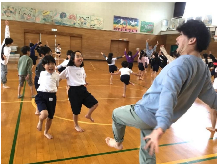
新鶴見小学校（鶴見区）

これまでに学校プログラムでは、コンテンポラリーダンスを軸に、音楽、美術、邦楽などの授業も実施しています。