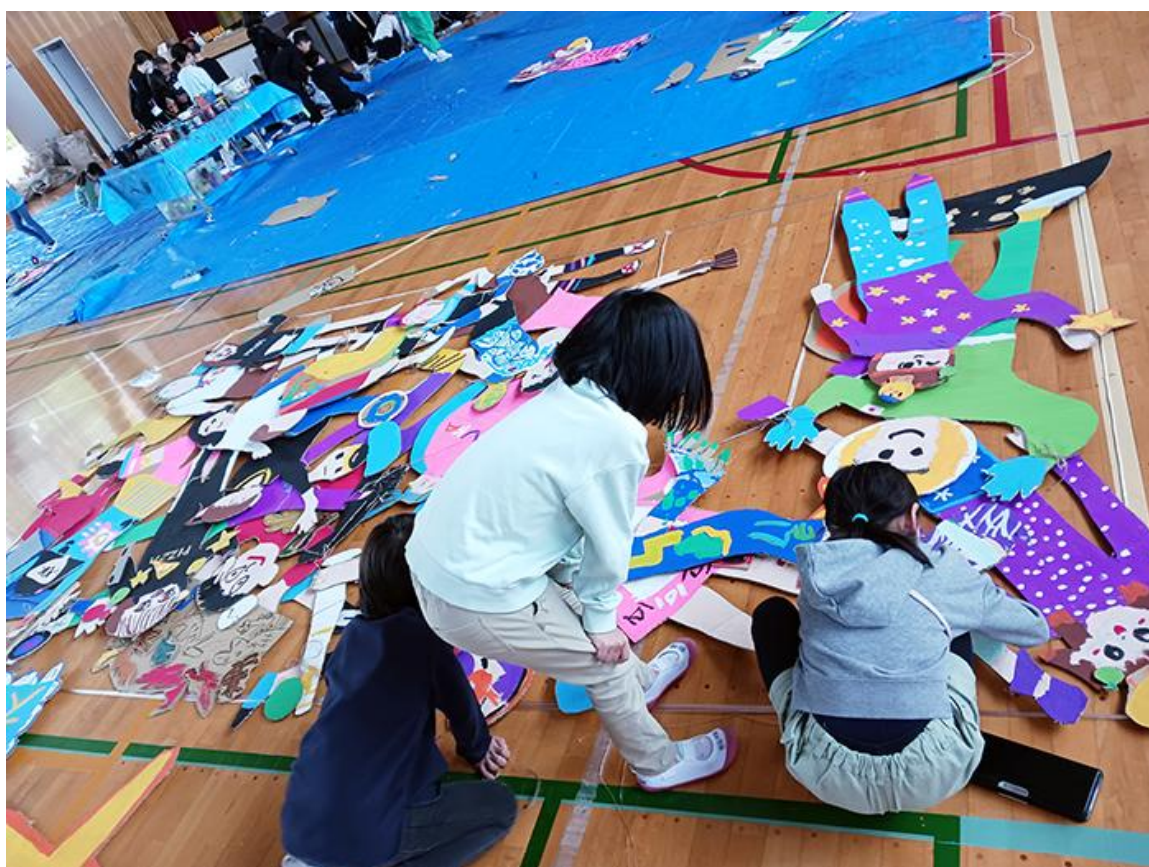
六浦南小学校（金沢区）

これまでに学校プログラムでは、民族音楽、作詞作曲、造形美術などの授業を実施しました。