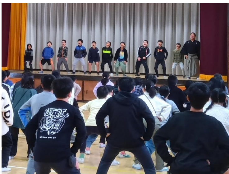
奈良小学校（青葉区）