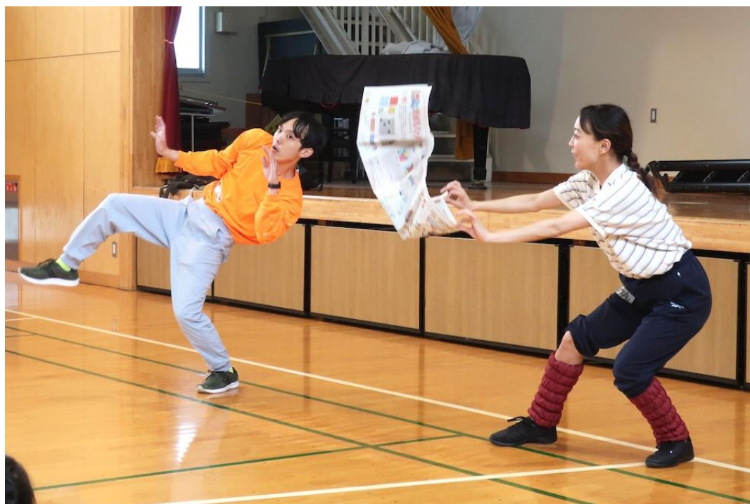
篠原小学校（港北区）

STスポット横浜は地域の芸術文化機関として、昭和62年に発足しました。小劇場「STスポット」を拠点に、現在国内外で活躍する多数の地元アーティストを輩出するなど、創造環境全体の向上に努めてきました。平成16～20年度には「アートを活用した新しい教育活動の構築事業」を神奈川県、県教委との協働事業として実施し、県内の幼稚園、小・中学校及び高等学校、特別支援学校等にアーティストを講師として派遣し、演劇やダンス、現代美術等の授業を行いました。平成20年度からは「横浜市芸術文化教育プラットフォーム」の事務局を担当し、学校教育とアートの現場をつなぐ事業を推進しています。これまでに学校プログラムでは、身体表現や現代美術、箏などの授業を実施しています。