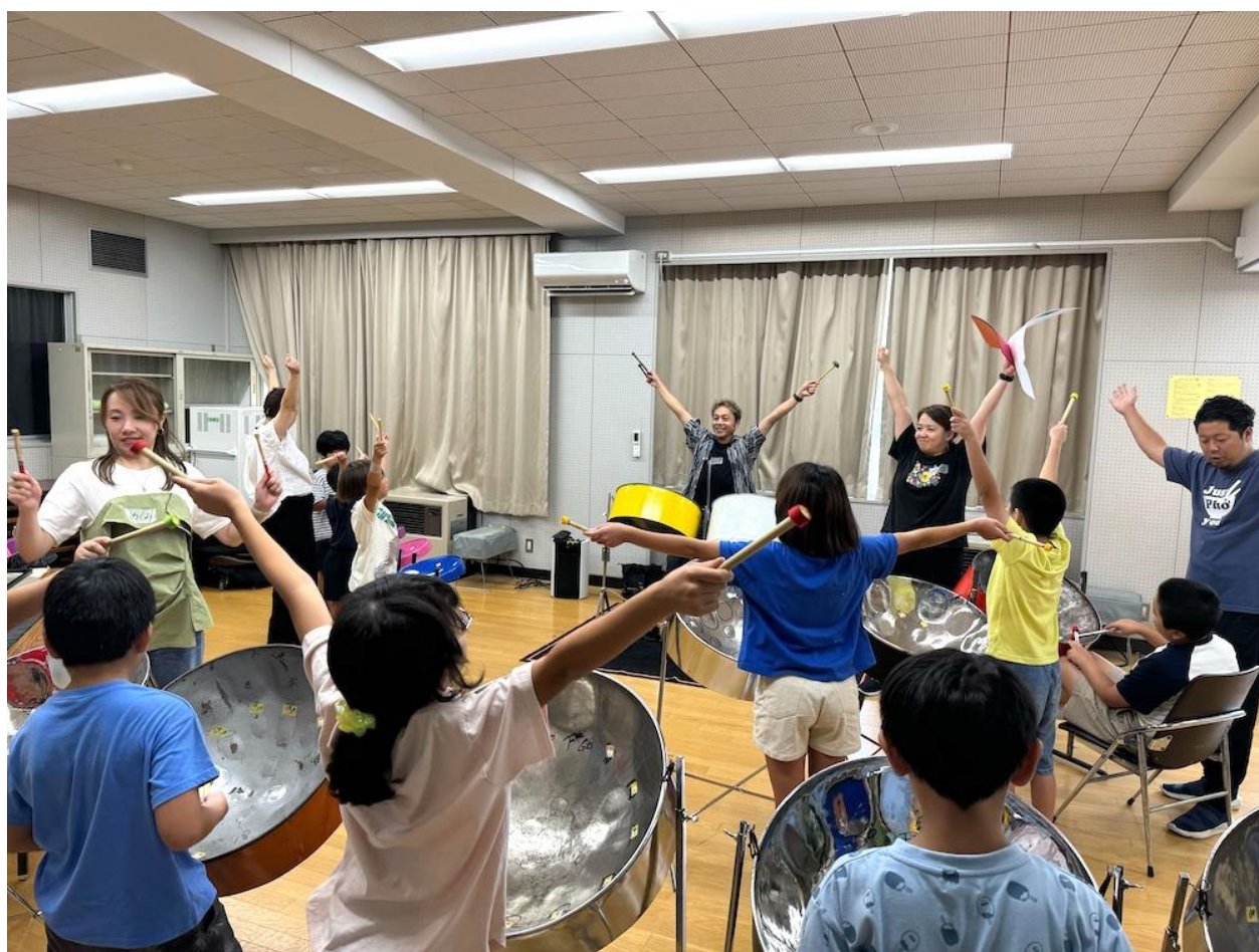
新羽小学校（港北区）

『「まち」「ひと」「とき」を文化で結ぶ』をキャッチコピーとし、地域の交流と文化芸術の活性化を図っています。多彩なプログラムやイベントをこれから企画・運営を行うことで、皆様とともに成長し、充実した文化芸術の体験を提供していく所存です。