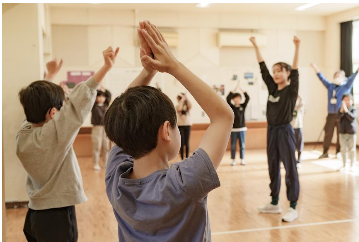
瀬谷第二小学校（瀬谷区）

2022年3月1日に開業した横浜市瀬谷区にある文化施設です。昇降式ステージを使用して、コンサートや発表会、鏡面壁を使用するダンスの練習、大人数でのオーケストラの練習など、多用途に使用できる音楽多目的室の他に、2部屋あるギャラリーは個別での利用はもちろん、2部屋を繋げて利用でき、さらに隣接する会議室も繋げる事によって自由度の高い展示スペースを創り出せます。3部屋ある会議室も個別での利用の他に繋げて利用する事で、大人数での会議にも対応可能です。練習室は、グランドピアノを要しアコースティックな楽器の練習に適した部屋と、ドラムセットやギターアンプ、ベースアンプを完備したバンド練習に適した部屋の2部屋があります。貸館業務のほかに、地域の芸術文化振興と瀬谷区の新たな文化拠点として、コンサートや展覧会、ワークショップなど様々なイベントを開催しています。