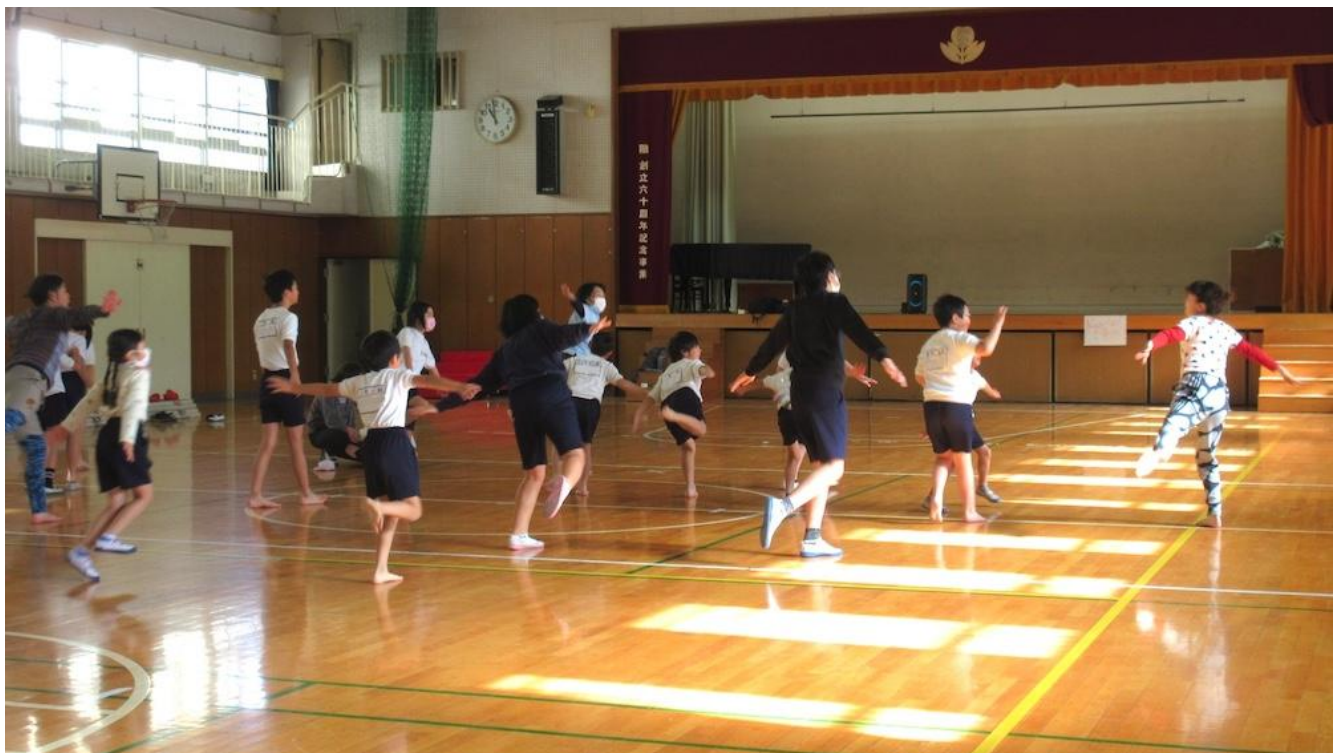
平安小学校（鶴見区）

横浜市芸術文化教育プラットフォーム／学校プログラムでは、2007年度より授業のコーディネートを担当しています。これまでに学校プログラムでは、コンテンポラリーダンスやパフォーマンス創作などの授業を実施しています。