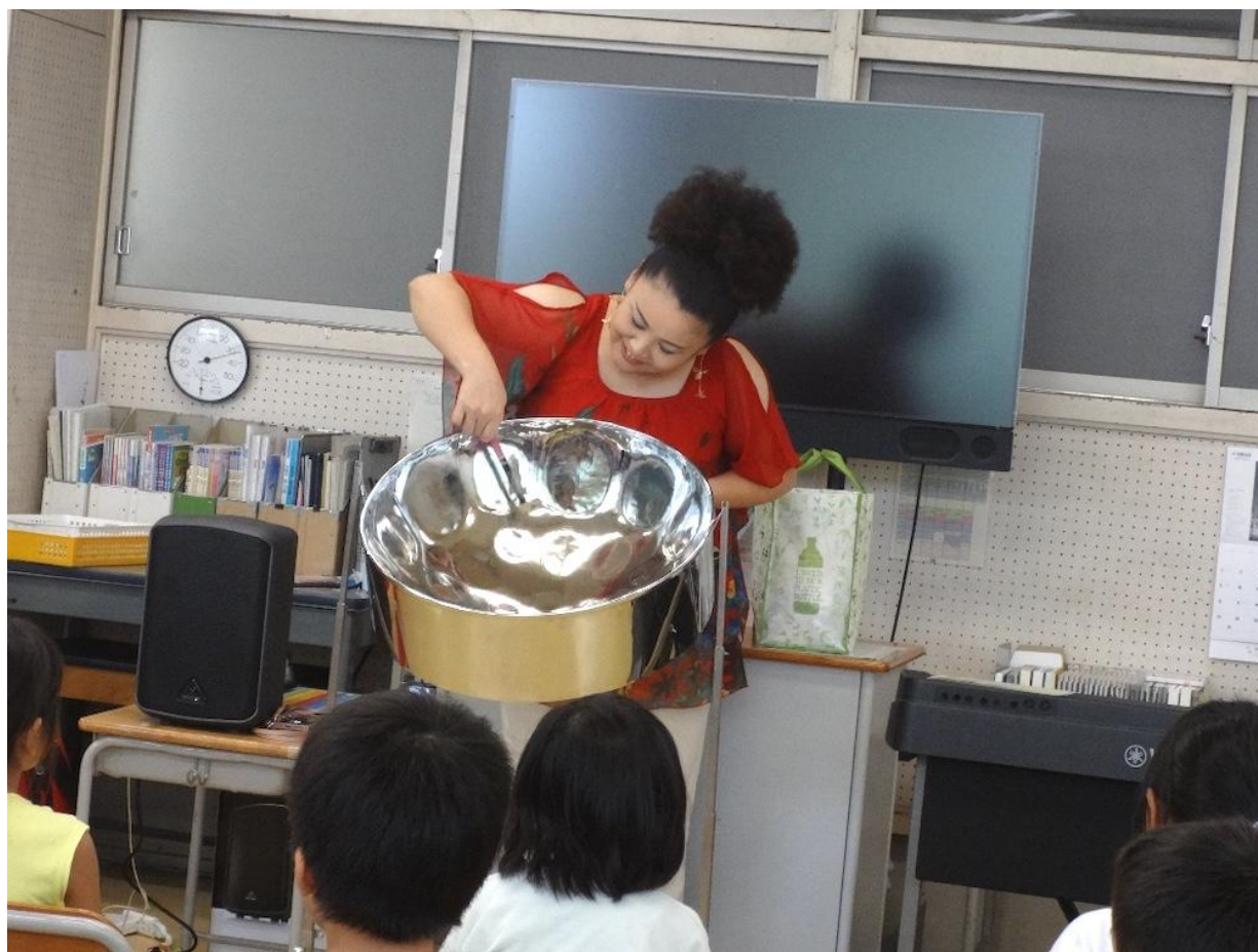
汐入小学校(鶴見区)

2006年より「横浜市芸術文化教育プログラム」コーディネーター。1998年発足した「企画集団MUGEN」を母体に2005年設立の企業組合Media Globalを経て現在に至る。親子・子どものワークショップを得意とする。行政との協働・アートにかかわる人々とのネットワークを軸に活動をしている。 これまでに学校プログラムでは、幅広いジャンルの授業を実施しています。