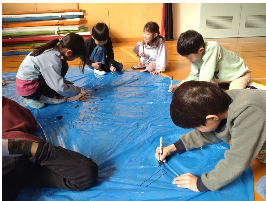
さわの里小学校（磯子区）

横浜市磯子区民文化センター杉田劇場は、2005年2月5日に開館以来、磯子のまちの地域力、区民力を活かし、文化力で地域や人をつなぎ、区民が活躍する魅力ある磯子のまちづくりに貢献することを目標に掲げています。おかげさまで、2025年2月に開館20周年を迎えました。今後も芸術・文化の拠点施設として、地域に根差した事業に一層取り組んでまいります。 これまでに学校プログラムでは箏や能、造形などの授業を実施しています。