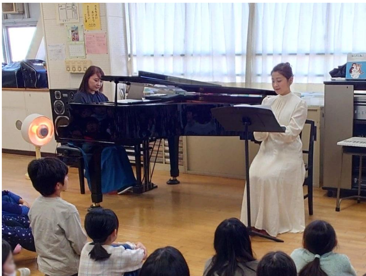
みたけ台小学校(青葉区)

学校プログラムでは、教科書の中の作品や大佛作品を用いて、音楽と朗読のコラボレーションを体験するプログラムを実施していく予定です。