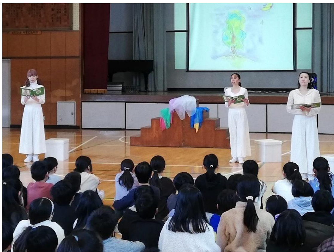
あざみの第二小学校（青葉区）

これまでに学校プログラムでは、打楽器やサクソカルテット、音楽ワークショップなどの授業を実施しています。