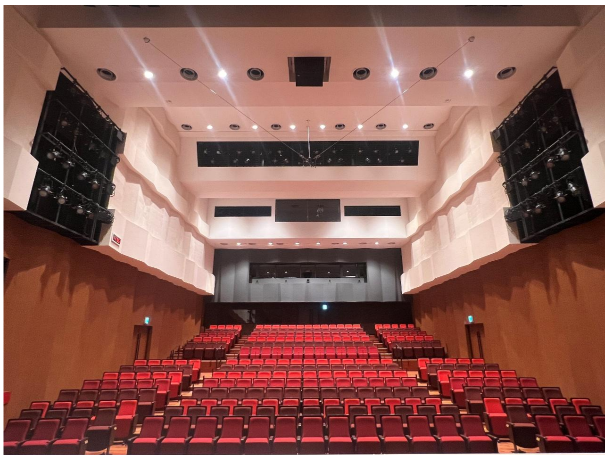
ボッシュ ホール 客席

「ボッシュ ホール（都筑区民文化センター）」は2025年3月16日に開館した、ホール、ギャラリー、リハーサル室などを備えた文化施設です。地域に根差した個性ある文化の創造をミッションとする「区民文化センター」のうち、市内で13番目の施設です。当館は「ボッシュ株式会社」がネーミングライツ・スポンサーとなり、愛称「ボッシュ ホール（英語名：Bosch Hall）」として開館しました。