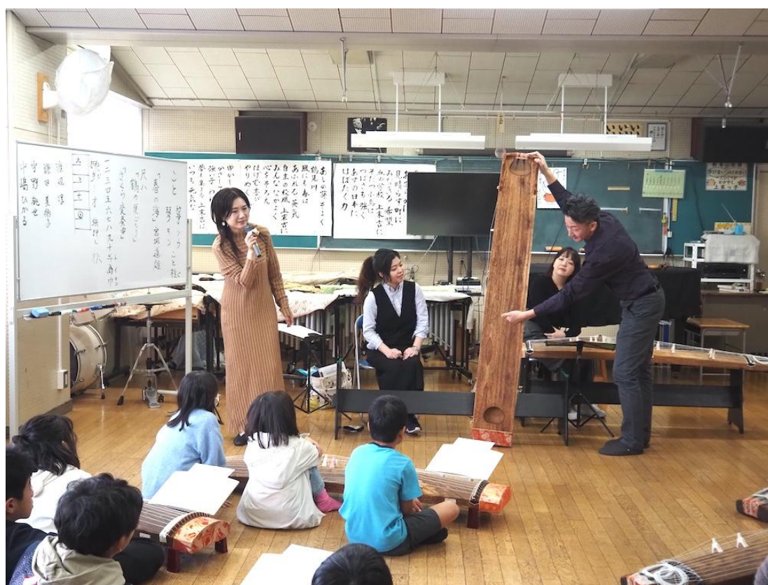
上末吉小学校（鶴見区）

平成23年(2011年)3月に開館した横浜市鶴見区にある文化施設です。通常時548名を収容し、音楽・演劇・ダンスなど用途に合わせて使用できる4Fホールの他に、100名を収容する残響豊かな3F音楽ホール、自由自在に芸術作品を展示できるギャラリー、リハーサル室、練習室を兼ね備えています。貸館業務・自主事業制作を行うほか、地域の文化振興と鶴見の文化拠点として、近隣学校等においても多角的な活動を目指しています。サルビアホール独自のオーディションによって選ばれた「サルビア・アーティストバンク」には、多彩な才能あふれるアーティストたちが登録されています。これまでに学校プログラムでは、ジャズ、箏、落語、和太鼓、ダンスの授業を実施しています。