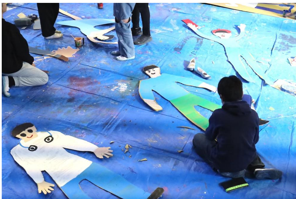
永谷小学校（港南区）

私共、京急グループ共同企業体は平成18年度より、指定管理者として、上大岡の中心にある「港南区民文化センター ひまわりの郷」を運営しております。地域の方々のニーズに答えながら、年間50本程度の様々な事業を展開しております。子どもからシニアまで幅広い年齢層に対応するコンサートや体験型イベントを行なっています。（低料金で質の高いクラシックコンサート、乳児も対象の親子で楽しむ音楽コンサート、シニアを対象にした日本の伝統芸能（邦楽、落語）、小・中・高これまでに学校プログラムでは、民族楽器や合唱などの授業を実施しています。