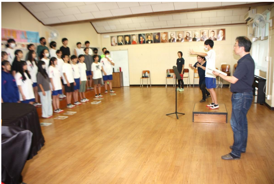
大道中学校（金沢区）

横浜市市民文化会館関内ホールは、1,000席規模を有する唯一の市民文化会館として、昭和61年（1986年）に開館し、平成30年（2018年）大規模な改修工事を終えてリニューアルオープンしました。 元・横浜宝塚劇場であったDNAを受け継ぎ、文化芸術の楽しさと感動を幅広く提供し、3路線が利用できる便利な立地を生かし、市民に親しまれる文化の拠点を目指して活動しています。 横浜開港以来150年以上の歴史とともに歩んできた馬車道の中心に位置し、このエリアへの誘客上も大きな役割を持っています。その上で、市民文化会館として幅広い年齢層の方のご利用、ご来場を念頭に「市民の文化・芸術への取り組み成果発表の場」「さまざまな芸術、芸能鑑賞機会の場」を提供するとともに、「次代の担い手育成」「地域と連携したにぎわい創出」にも貢献することを目指しています。 学校プログラムでは、これまでに、合唱・発声指導、お箏や雅楽などの伝統芸能、ラテン音楽（ボンゴ）の授業を実施しています。