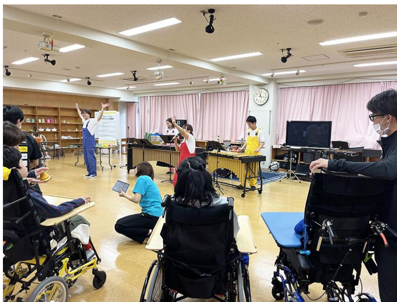
若葉台特別支援学校（旭区）

これまでに学校プログラムでは、ミュージカルやゴスペル、演劇創作などの授業を実施しています。