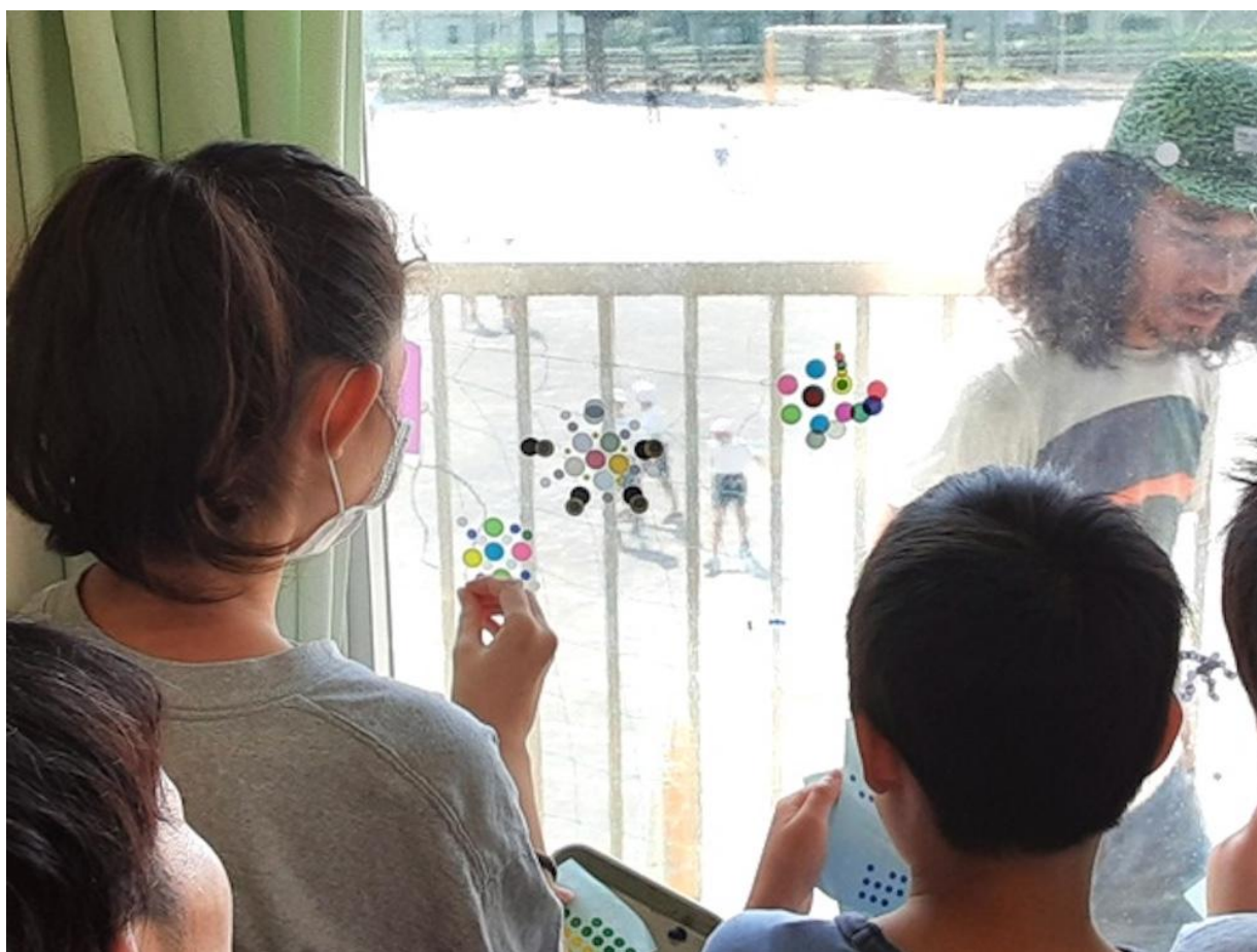
岩崎小学校（保土ケ谷区）

これまでに学校プログラムでは、造形やラテン音楽、お芝居づくりなどの授業を実施しています。