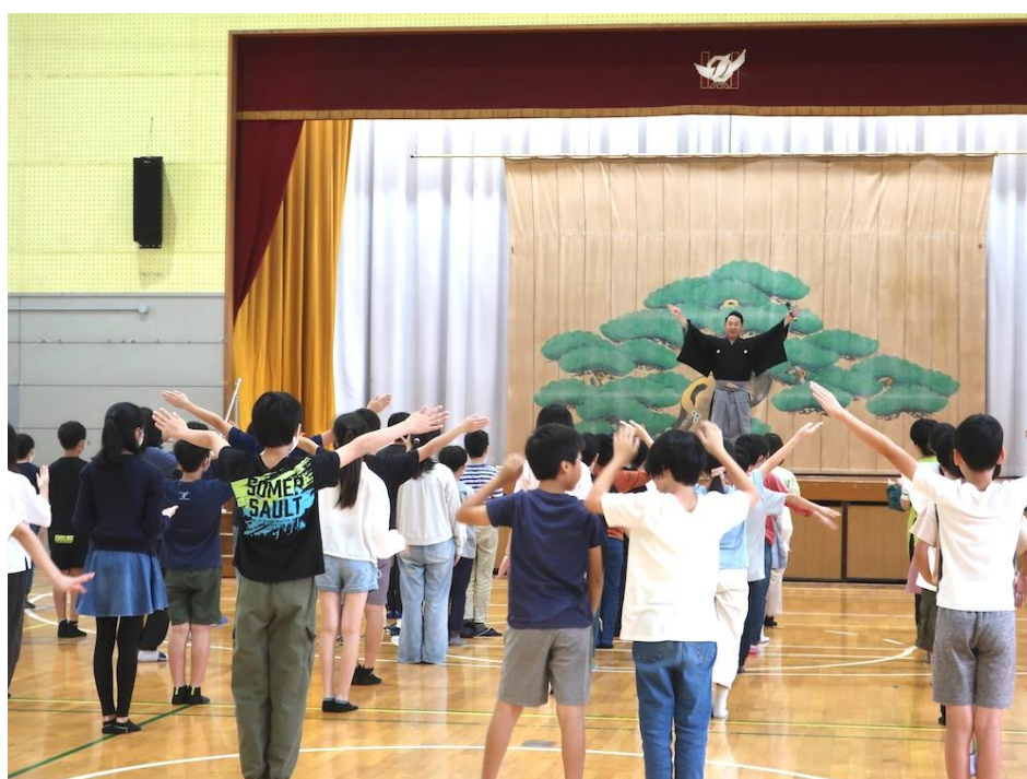
東品濃小学校（戸塚区）

大規模改修工事のため2024年1月から2年半の休館をしている横浜能楽堂は、「つなぐ・つながる」をコンセプトに、休館中も市内各所で活動しています。横浜市の全18区で、能・狂言の普及公演やワークショップ、講座などの事業を展開しています。また、能・狂言の普及のための施設「OTABISHO横浜能楽堂」をみなとみらいのランドマークプラザ5階にオープンしました。全国初の、ショッピングモールに入る能・狂言を紹介する施設として、「見る・知る・体験する・学ぶ」をコンセプトに、能面や装束、楽器、横浜能楽堂の舞台を再現した模型などの展示や、能・狂言関連の本が読める図書コーナー、関連グッズの販売も行っています。