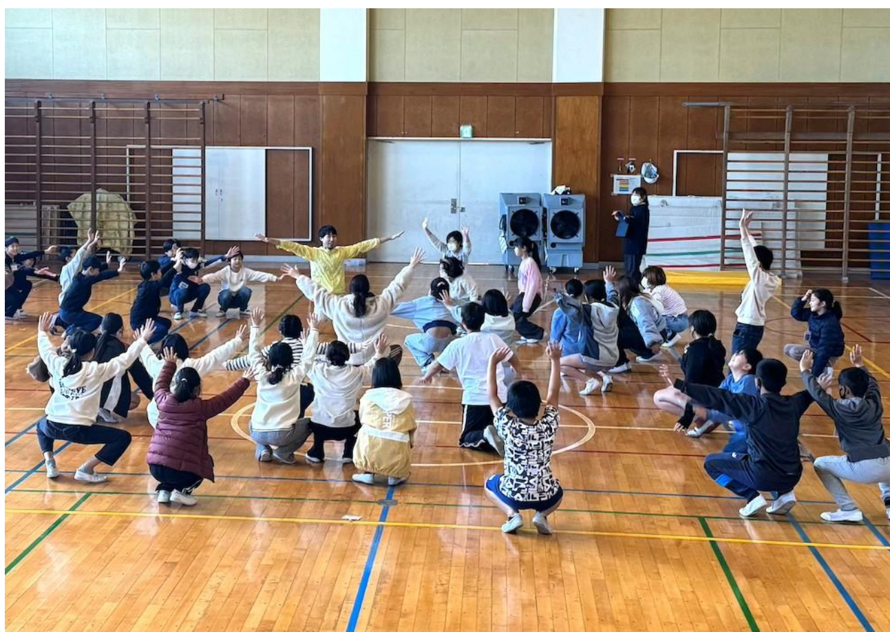
朝比奈小学校（金沢区）

これまでに学校プログラムでは、コンテンポラリーダンスや演劇創作、演劇鑑賞などの授業を実施しています。