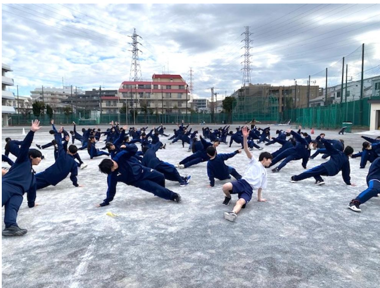
矢向中学校（鶴見区）

1913年に創建された横浜赤レンガ倉庫1号館は、2002年にリニューアルされ「芸術文化の創造発信」と「賑わいの創出」を目指した文化施設として運用されています。2・3階は「ホール&スペース」となっており、コンサートやギャラリーなどの貸出施設として、幅広いジャンルのイベントに使われています。 主催事業はコンテンポラリーダンスと現代アートを中心に展開し、芸術文化活動と賑わい創出を総合的に振興しています。これまでに学校プログラムでは、身体表現、コンテンポラリーダンスなどの授業を実施しています。