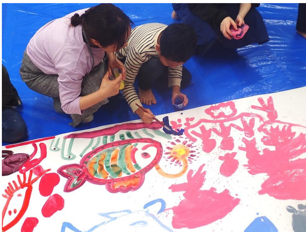
さつきが丘小学校（青葉区）

これまでに学校プログラムでは、当館における講座活動の経験を活かして、様々な造形の授業を実施しています。