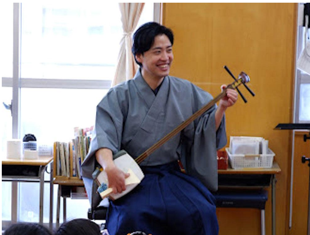
西寺尾第二小学校（神奈川区）

学校プログラムでは、クラシック鑑賞や邦楽、造形などの授業を実施しています。さらに、学校や図書館へのアウトリーチにも取り組み、区民の皆様に親しまれ頼られる施設を目指します。