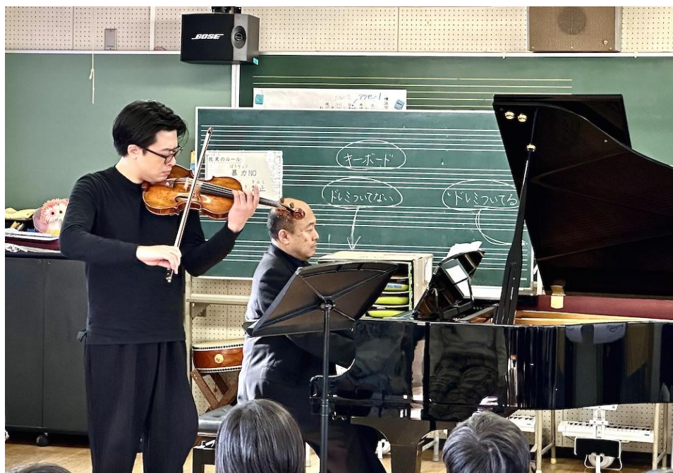
谷本小学校（青葉区）

これまでに学校プログラムでは、ヴァイオリン、チェロやピアノなどの授業を実施しています。