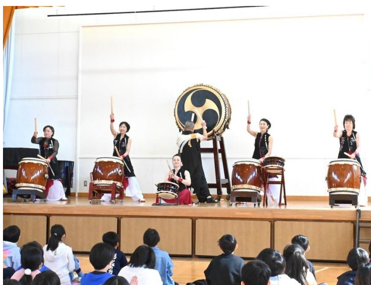
小雀小学校（戸塚区）

これまでに学校プログラムでは、音楽や演劇、小鼓や箏・津軽三味線などといった伝統芸能の授業を実施しています。